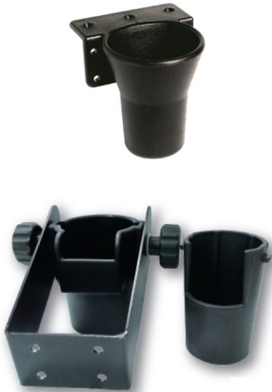
*KH-6 und KH-7 mit schwenkbarem Halter und Kunststoffeinsatz